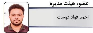
عضو هیئت مدیره احمد فواد دوست