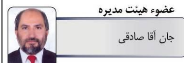
عضو هیئت مدیره جان آقا صادقی