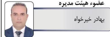
عضو هیئت مدیره بهادر خیرخواه