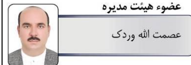
عضو هیئت مدیره عصمت الله وردک