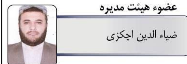
عضو هیئت مدیره ضیاء الدین اچکزی